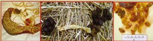
ଗୋଲ କୃମି ଫିତା କୃମି ପତ୍ର କୃମି

ଅନ୍ତଃ କୃମି : ଗୋଲ କୃମି, ଫିତା କୃମି, ପତ୍ର କୃମି, ରକ୍ତଶୋଷଣକାରୀ କୃମିମାନ ଶରୀରରେ ରହି ଖାଦ୍ୟ ହଜମରେ ବାଧା ସୃଷ୍ଟି କରନ୍ତି ଓ ଶରୀରରୁ ରକ୍ତ ଶୋଷଣ କରନ୍ତି । ଏମାନଙ୍କ ଯୋଗୁଁ ଛେଳି ଭଲ ବଢେ ନାହିଁ । ଏଣୁ ବର୍ଷକୁ ତିନିରୁ ଚାରିଥର କୃମିନାଶକ ଔଷଧ ଦେଇ ଛେଳିମାନଙ୍କୁ ଅନ୍ତଃକୃମିରୁ ରକ୍ଷା କରାଯାଇପାରିବ । ପ୍ରତିଷେଧକ ପଦ୍ଧତି ଅନୁଯାୟୀ (୧)ଦୁଇ ମାସର ଛେଳିଛୁଆଙ୍କୁ କେନ୍ଦୁଆ ମାରିବା ଔଷଧ ଦେବା ଉଚିତ୍ । (୨) ଚାରି ମାସର ହୋଇଗଲେ ପତ୍ରକୃମି, ପାକପୁଳୀ, କ୍ଷୁଦ୍ର ଓ ବୃହତକ୍ତ କୃମି ଔଷଧ ଦିଆଯିବ । (୩) ବର୍ଷାଦିନ ଶେଷରେ ଗୋଠରେ ଥିବା ସମସ୍ତ ଛେଳିଙ୍କୁ କୃମିନାଶକ ଔଷଧ ଦେଇଦେବା ଉଚିତ୍ । (୪) ଶୀତଋତୁ ଶେଷରେ ପୁଣିଥରେ ଔଷଧ ଦିଆଯାଇଥାଏ ।