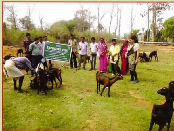
ଅଧିକ ବିବରଣୀ ପାଇଁ କୃଷି ବିଜ୍ଞାନ କେନ୍ଦ୍ର, ଅନୁଗୋଳ ସହିତ ଯୋଗାଯୋଗ କରନ୍ତୁ ।

ଆମ ରାଜ୍ୟର ଜଳବାୟୁ, ପରିବେଶ ଓ ଛେଳି ମଂସର ଚାହିଦାକୁ ବିଶ୍ଳେଷଣ କଲେ ବ୍ୟବସାୟିକ ଭିତ୍ତିରେ ଛେଳିପାଳନର ଭିତ୍ତିଭୂମି ଅତି ଉନ୍ନତ । ଉତ୍ତମ ଚାରଣ ଭୂମି ଓ ଅନ୍ୟାନ୍ୟ ଆନୁସଙ୍ଗିକ ସୁବିଧା ଥିଲେ ଗୋଟିଏ ଛେଳିରୁ ଟ.୧୨୦୦-୧୪୦୦ ଲାଭ ମିଳିଥାଏ କିମ୍ବା ମାସକୁ ଗୋଟିଏ ଛେଳିରୁ ହାରାହାରି ୧୦୦ ଟଙ୍କା ଲାଭ ମିଳିଥାଏ । ଏଣୁ ଆମ ରାଜ୍ୟରେ ଆମ୍ ନିଯୁକ୍ତ ପାଇଁ ଗ୍ରାମଞ୍ଚଳରେ ଛେଳି ପାଳନ ଏକ ନିର୍ଭର ଯୋଗ୍ୟ ପଦକ୍ଷେପ ।